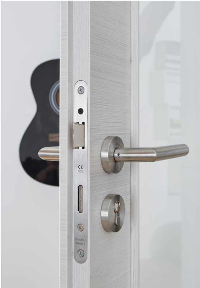
Beschlag RAVENNA mit Normalrosette und PZ-Schloss Klasse 3