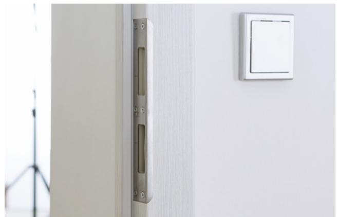
verstärktes Schließblech mit rückseitiger Metallplatte