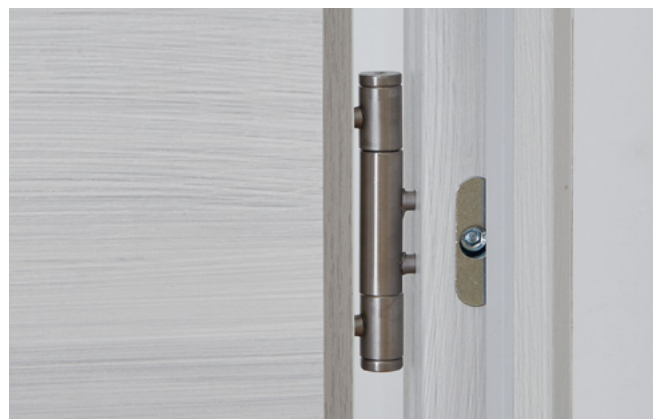
3-teiliges Band Blendrahmen