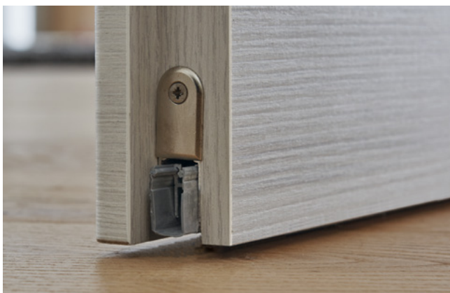
automatisch absenkende Bodendichtung