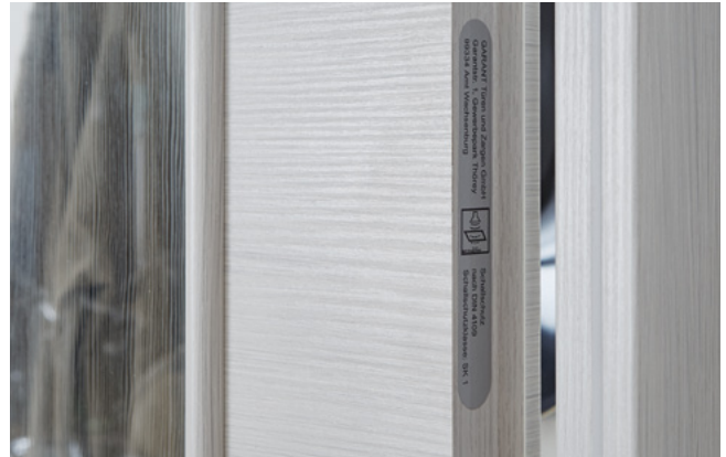
Funktionskennzeichnung im Türfalz