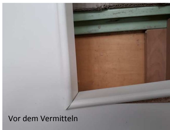
Vor dem Vermitteln

Die zweite eingelegte Glasleiste wölbt sich deutlich mehr