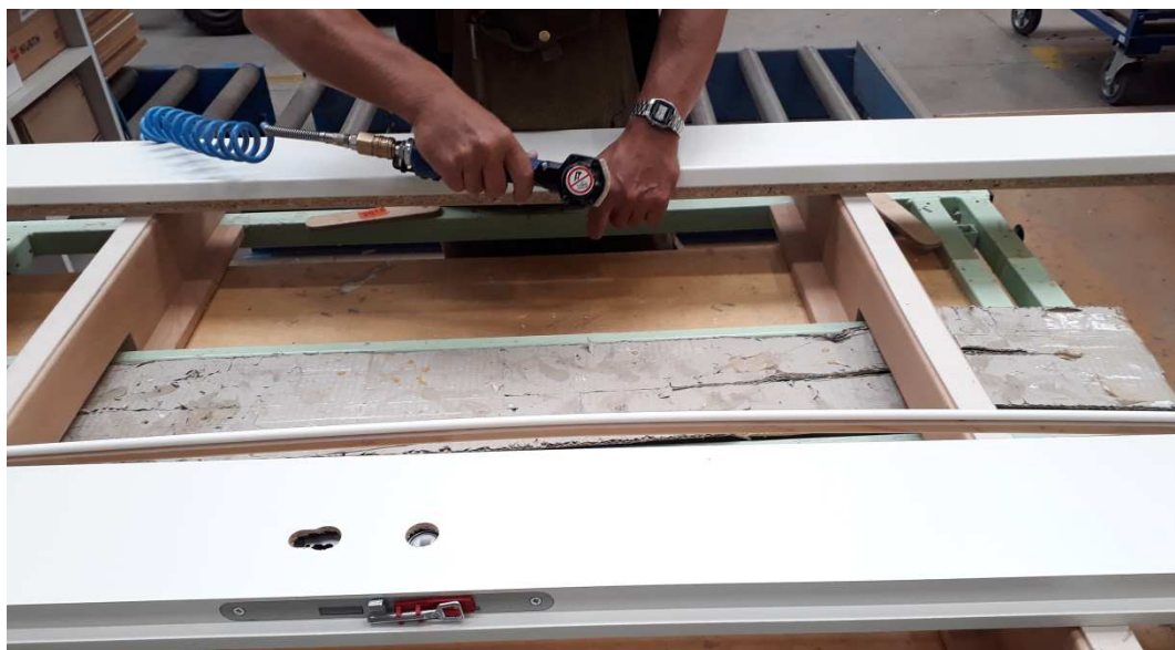
7. Lange Glasleisten nageln, in der Mitte beginnend! *