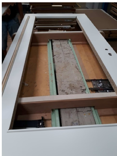
3. Obere und untere, kurze Glasleisten einlegen