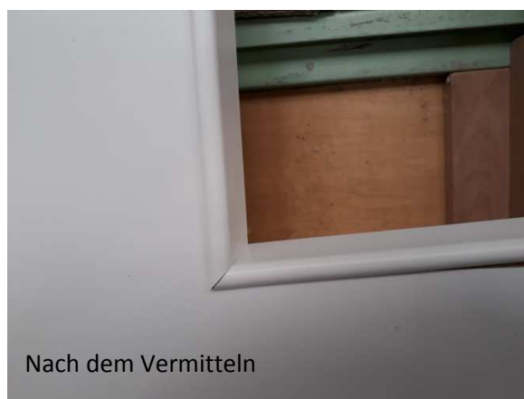
Nach dem Vermitteln

5. Glasleisten vermitteln, dass Gehrung innen passend ist