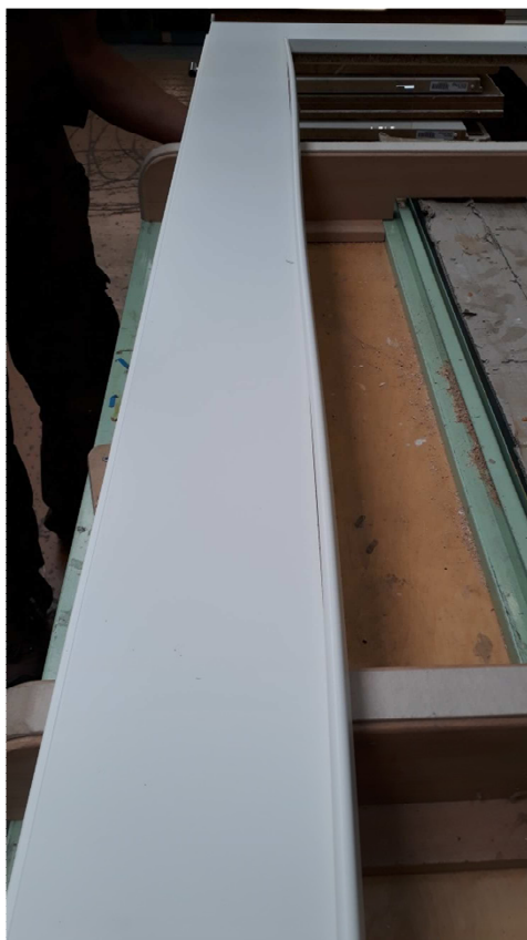
Nach erstem mittigem Nageln erscheint Glasleiste noch „bauchig“