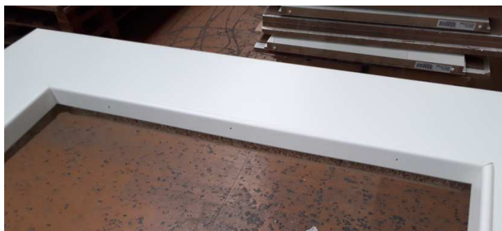
Fertig befestigte kurze Glasleiste