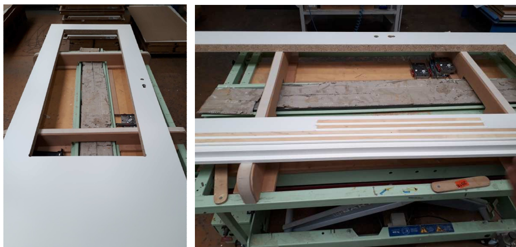
1. Lichtausschnitttür und Glasleistenstäbe bereit legen

Prüfen, ob Maße des Lichtausschnitt und der Glasleisten innerhalb der Toleranz liegen und keine optischen Mängel aufweisen.